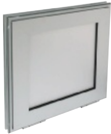
OXYTONE PANNEAU 2012 fermé, en position attente