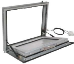
Ouvert, en position de sécurité