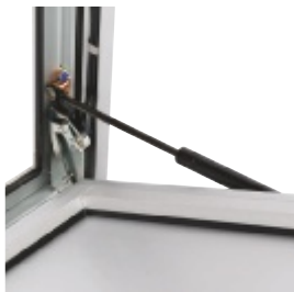
Vérins et contact intégré dans le profil